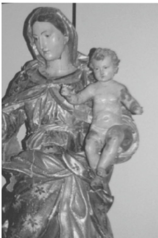
Escultura em Madeira policromada e dourada Altura: 152cm - Largura: 67cm Possui uma base (Pilar) com cerca de 30cm e uma escultura do Menino Jesus em madeira policromada (removível)

Após muitos anos de luta, foi dado início ao maior projeto de restauração da Igreja Matriz de Nossa Senhora do Pilar, em Duque de Caxias. Uma ação conjunta da Prefeitura, da Diocese e do Iphan, com o apoio de um conjunto de empresas sediadas na cidade.